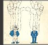
1975, dessin non signé, offert par Publicis à l'organisation de la semaine européenne de l'école centrale de Paris