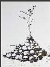
Legnica, exposition internationale Satyrykon 2024,Russian ballet de Viktor Kudin (UA)

Textes et photos : Gilles Mise en forme : Milène