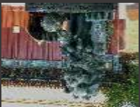
Pékin, Lyon gardien impérial mâle du templeYonghe symbolisant la suprématie sur le monde